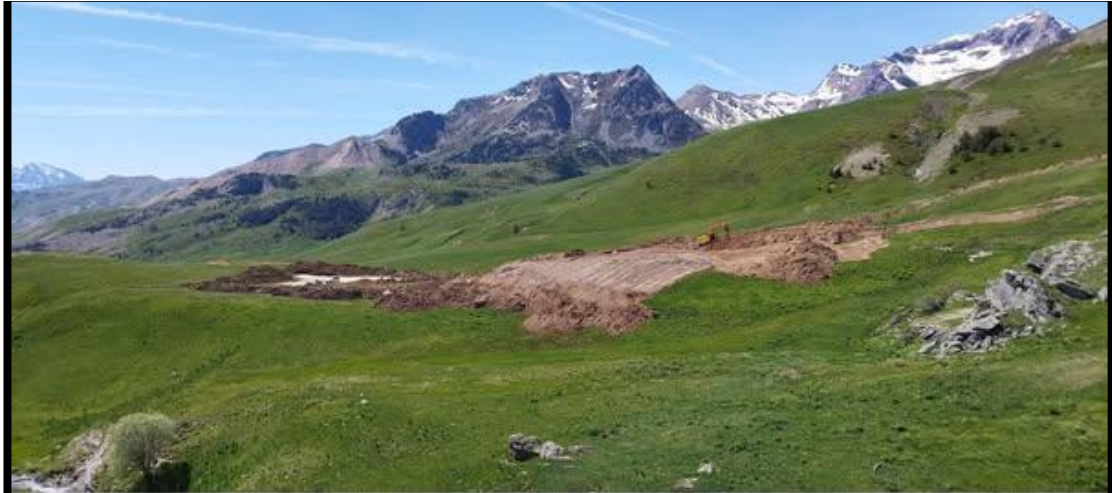
Zona de las obras en el Portalet.

https://www.boa.aragon.es/cgi-bin/EBOA/BRSCGI?CMD=VEROBJ&MLKOB=1391912661010