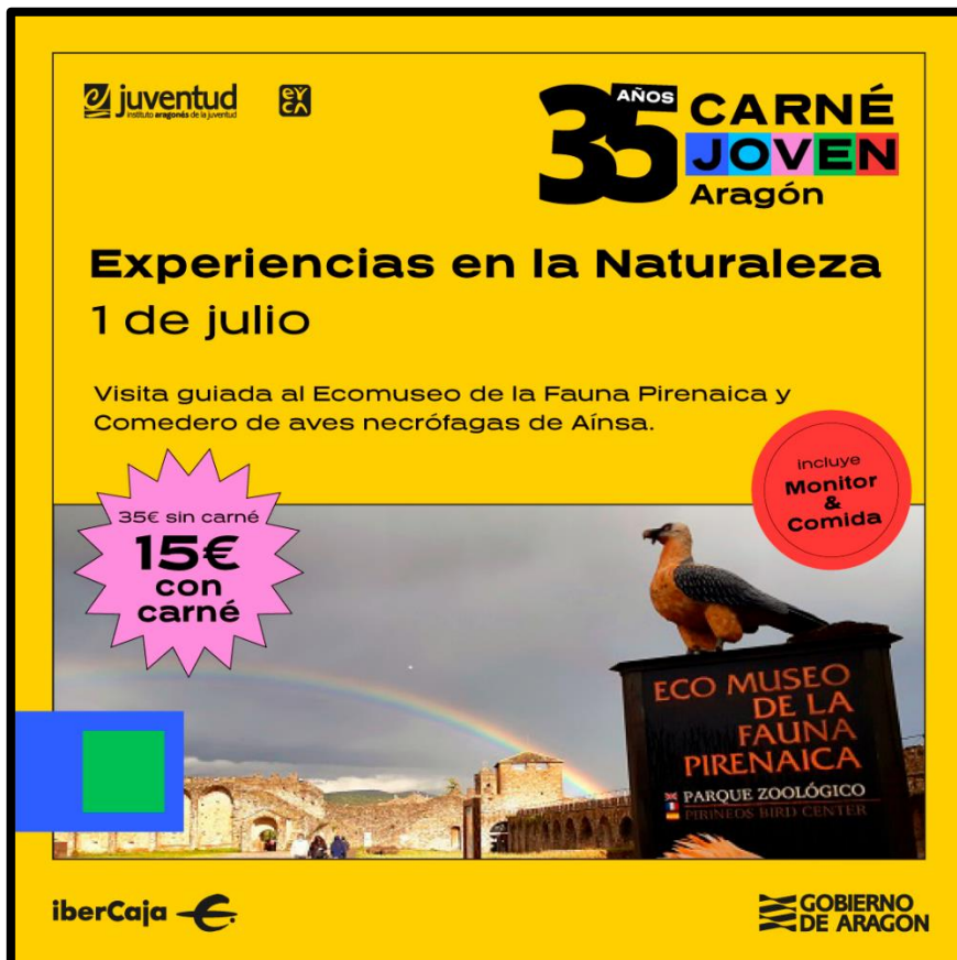
Carne Joven Aragón.