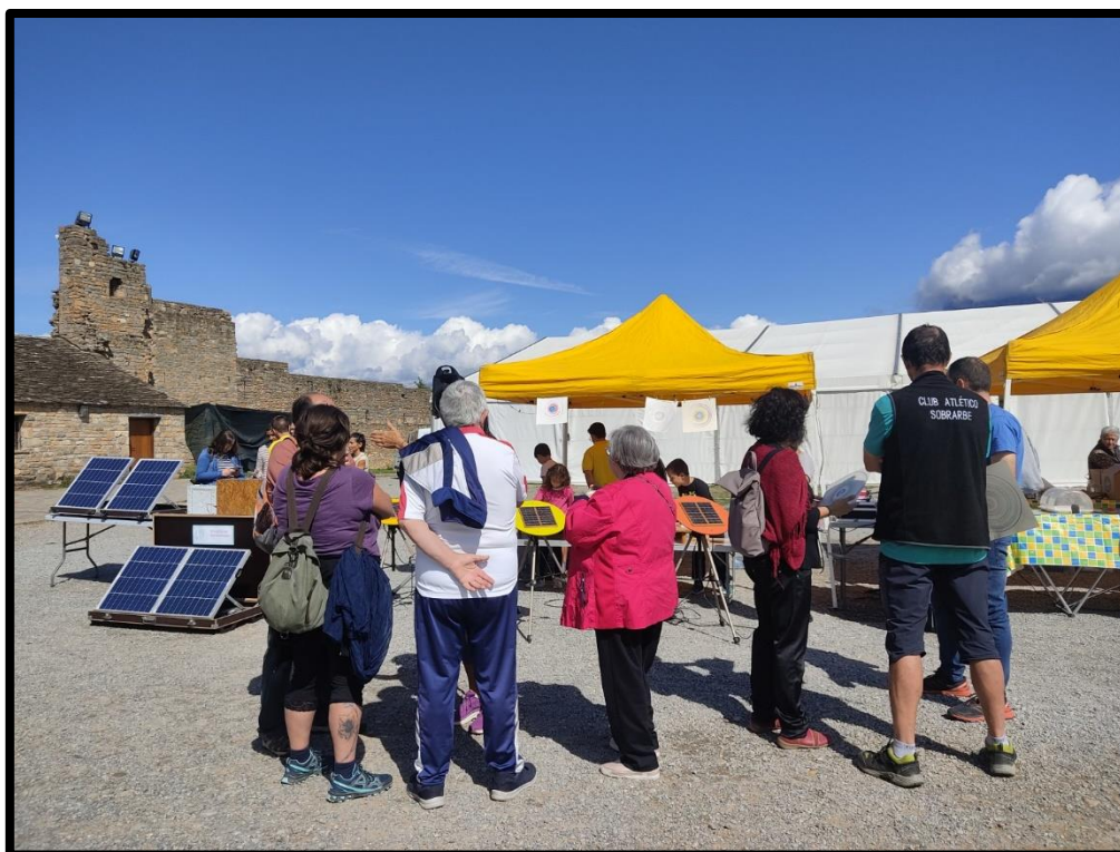
Talleres del Climatic Festival.