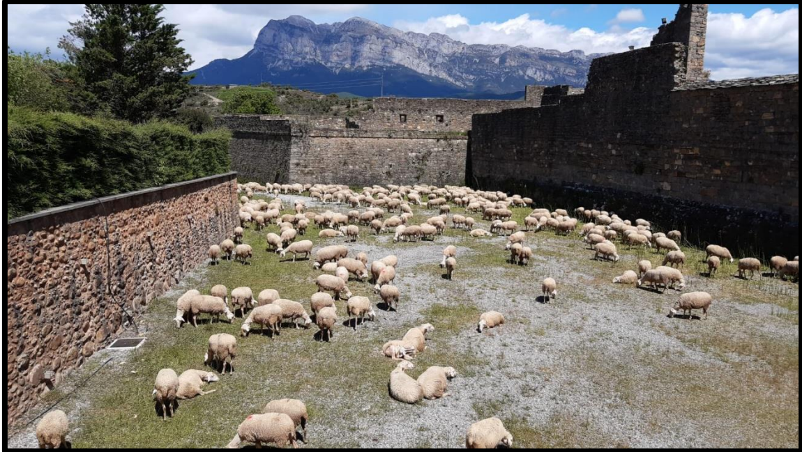
Ovejas pastando en el Castillo de Aínsa.

una nueva idea consistente en la implantación de un sistema de cercados virtuales controlados a través de una app en el móvil gracias a la instalación de los collares en los animales. En la Expo Feria de Sobrarbe se realizó en septiembre de 2023 charla sobre el funcionamiento de los GPS.