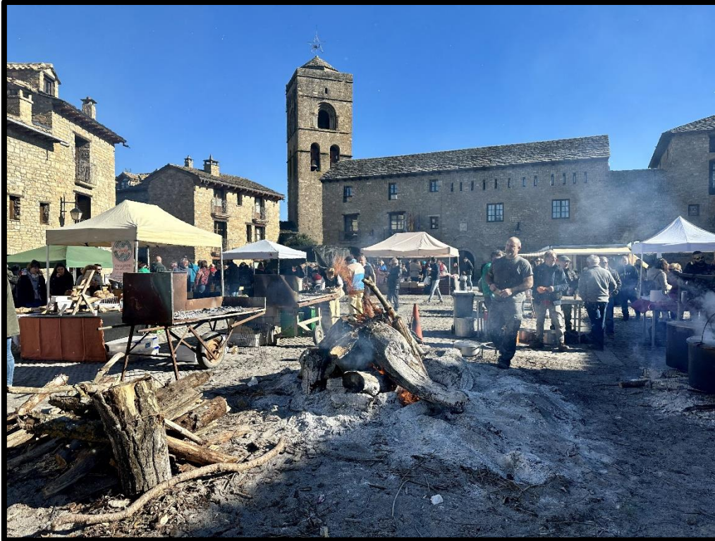
Ferieta en la plaza Mayor de Aínsa (2023).