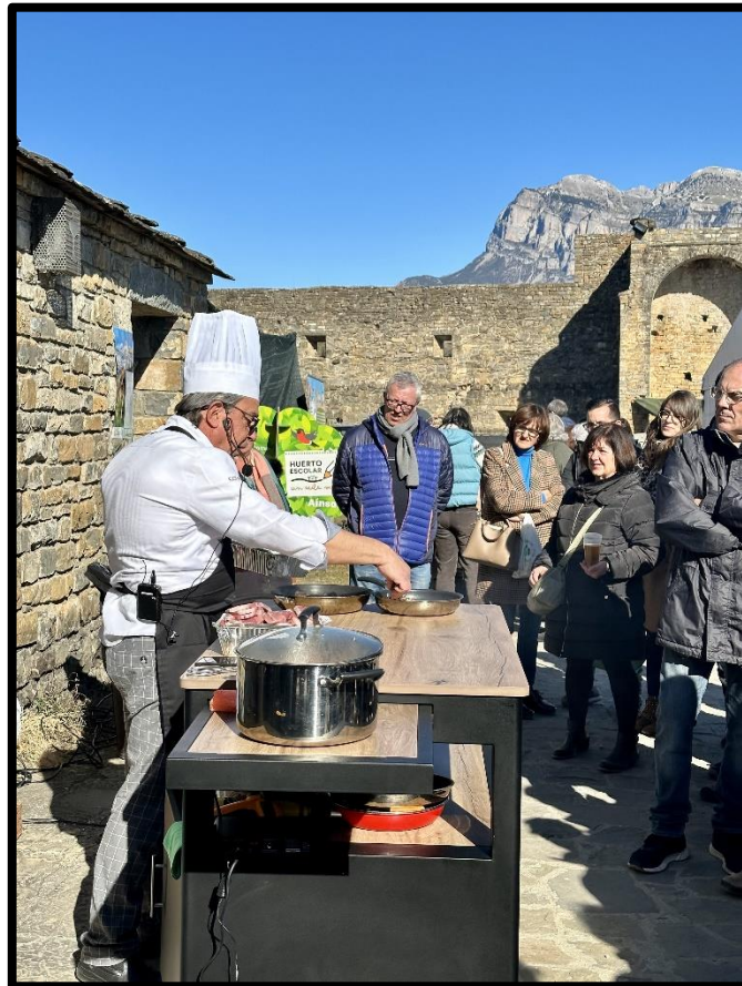
Degustación de ternera ecológica.