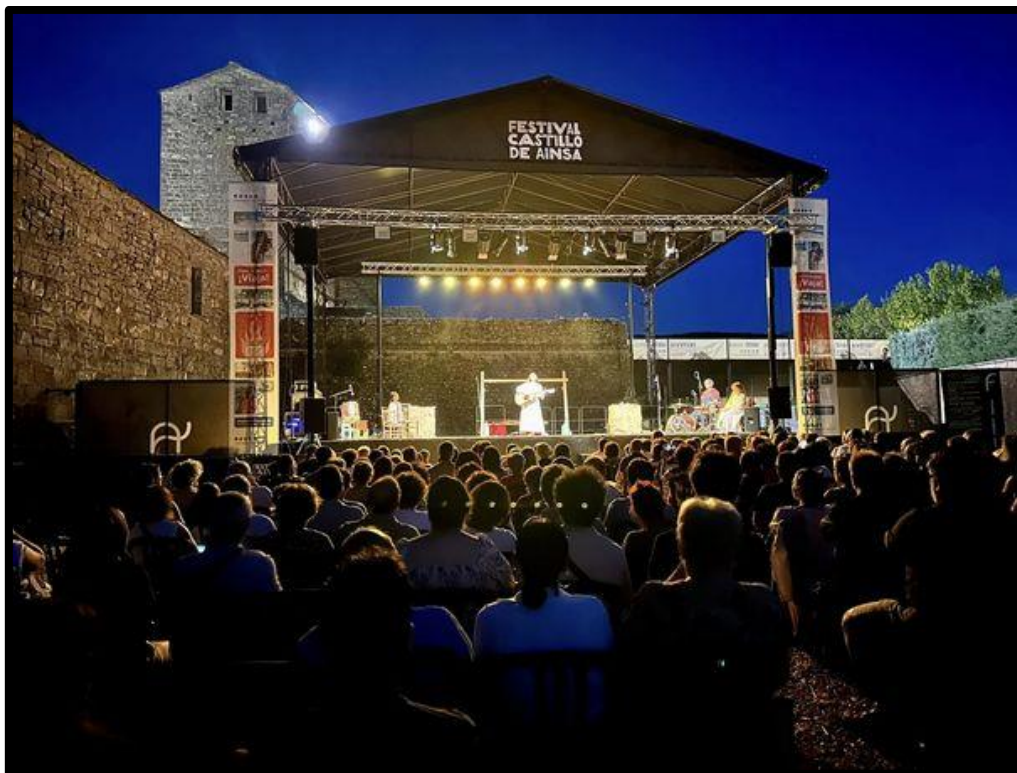
Estreno Festival Castillo de Aínsa obra “La Quebranta”.