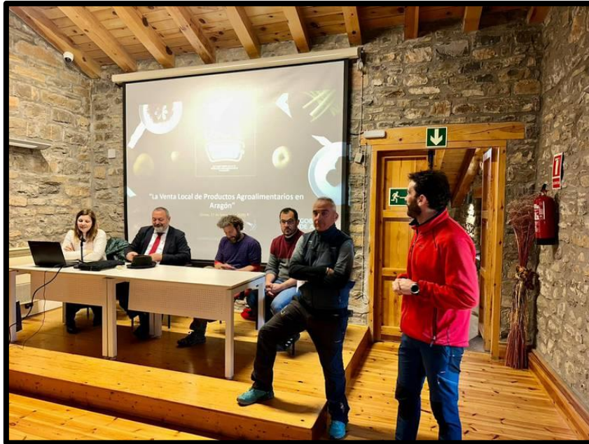
Jornada de sensibilización sobre la venta local en Aragón, en el Eco Museo de Aínsa.