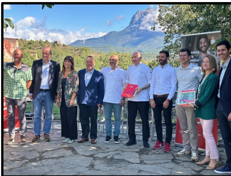
Acto de Hostelería Por el Clima en Aínsa (septiembre 2023).

https://www.diariodelaltoaragon.es/noticias/comarcas/sobrarbe/2023/09/22/el-callizo-el-origen-y-la-oficina-ejemplos-de-hosteleria-comprometida-con-la-sostenibilidad-1679489-daa.html