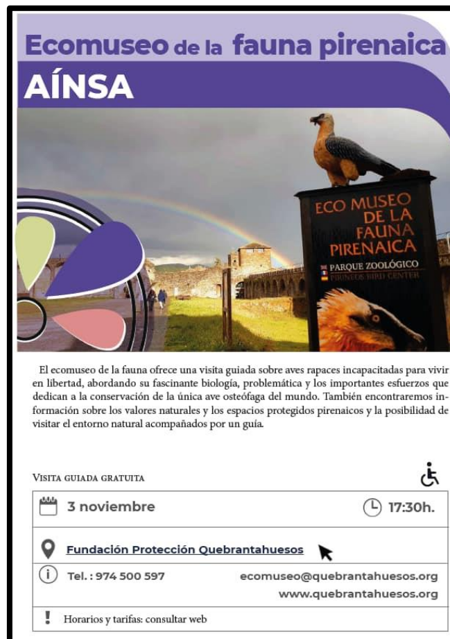
Jornadas de Museos en la Comarca de Sobrarbe.