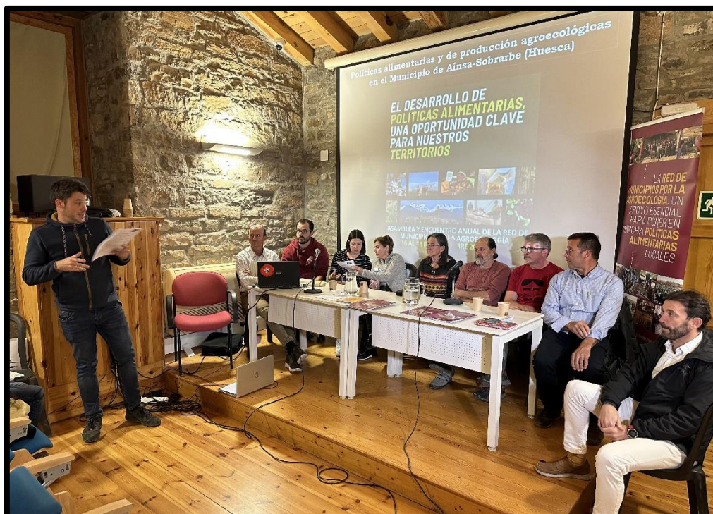
Mesa redonda con presencia de todos los sectores y agentes implicados.