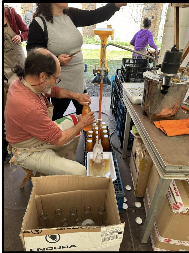
Elaboración de zumo con manzanas ecológicas.