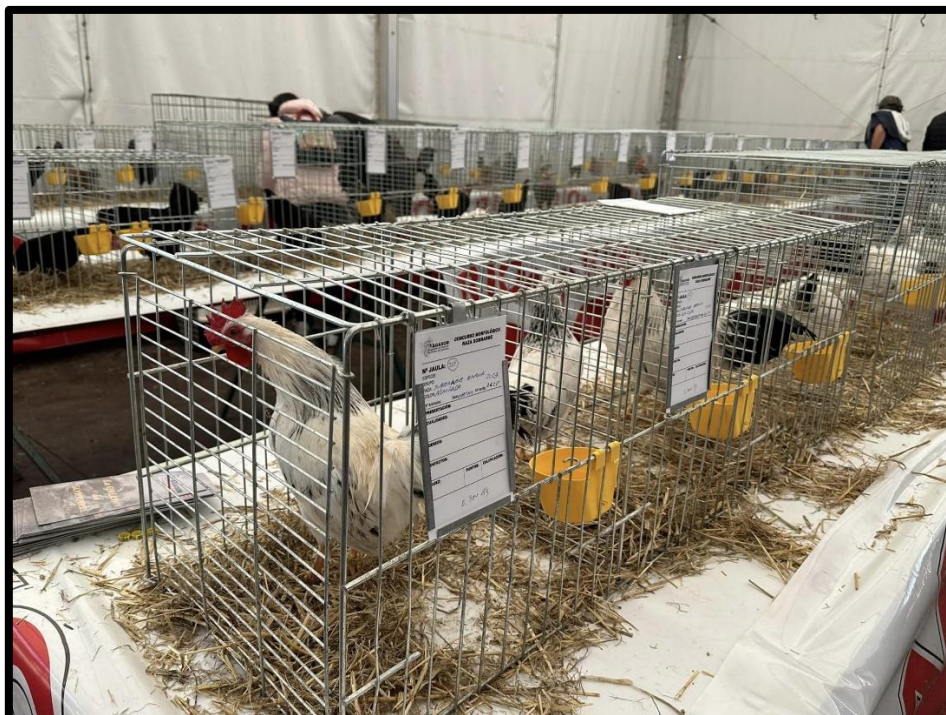
Gallina de Sobrarbe.