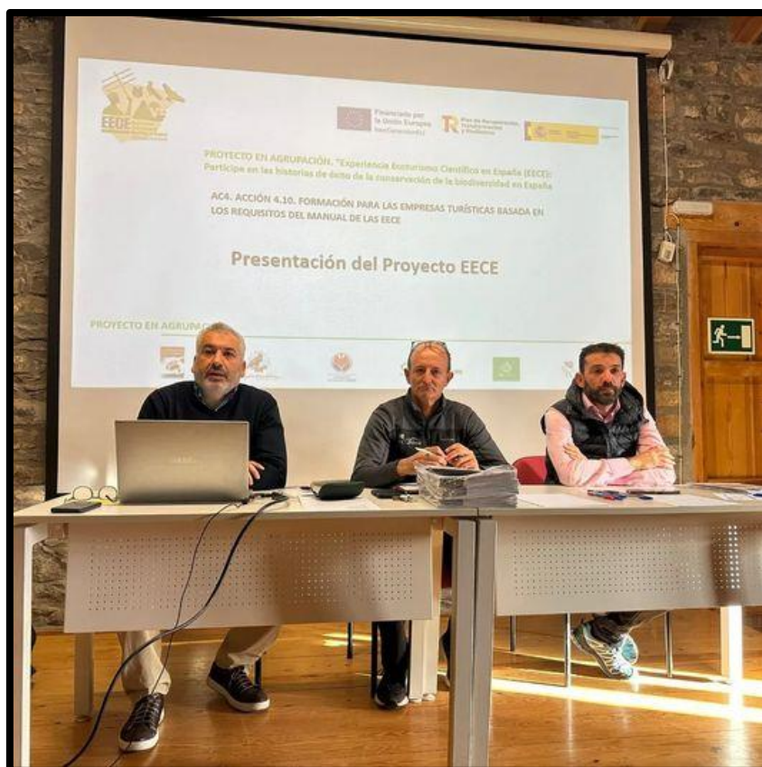
Presentación en el Eco Museo d EECE