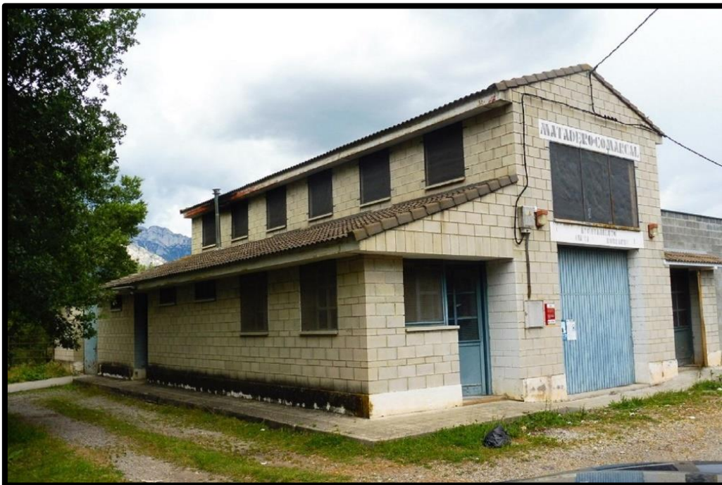
Matadero Municipal de Aínsa-Sobrarbe.

Durante 2023 se realizan gestiones con la Dirección General de Calidad y Seguridad Alimentaria del Gobierno de Aragón para que autorice a la FCQ a la eliminación a través del comedero de aves necrófagas de determinados restos MER (cabezas de vacuno y ovino mayores de 12 meses), evitando la gestión para su incineración por parte del matadero, evitando así un coste añadido (en agosto se autoriza por el Gobierno de Aragón).