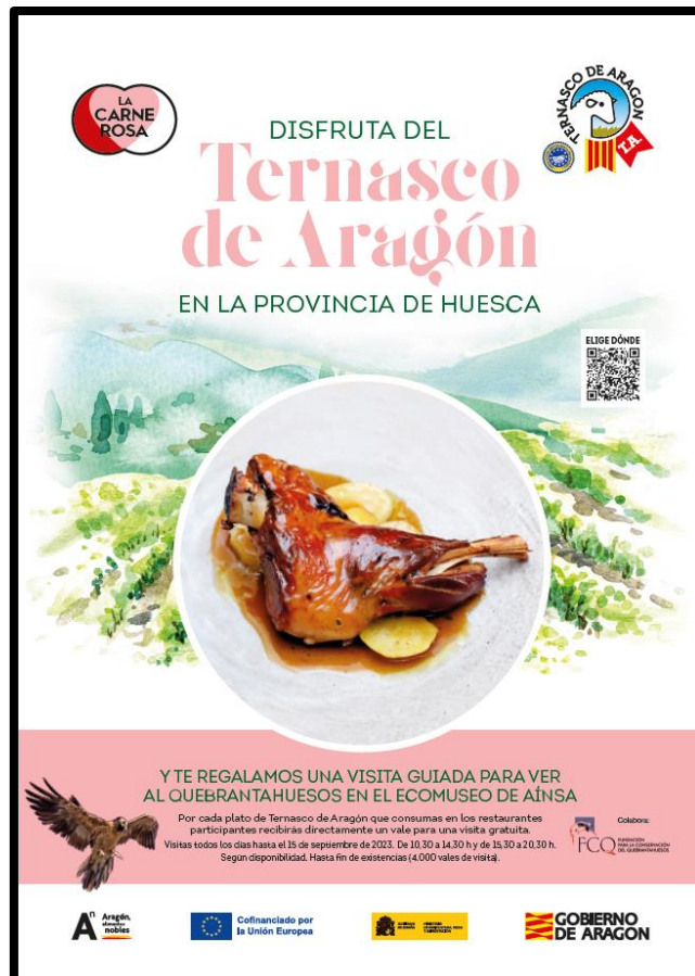
Cartel campaña ternasco de Aragón (2023).