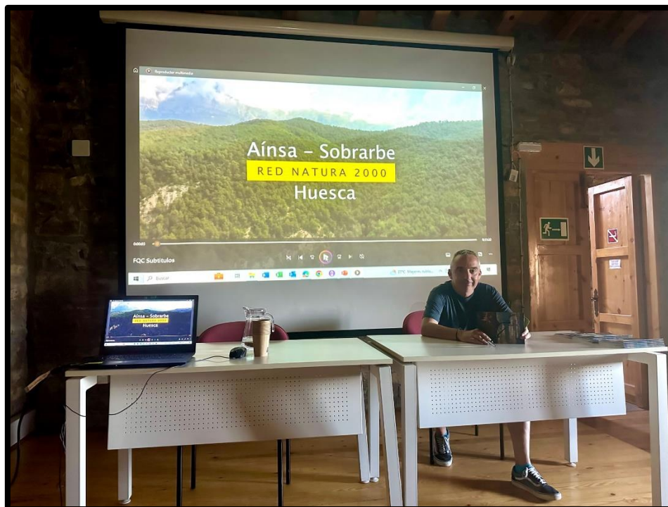
Charla sobre la Red Natura 2000 en el Municipio de Aínsa-Sobrarbe