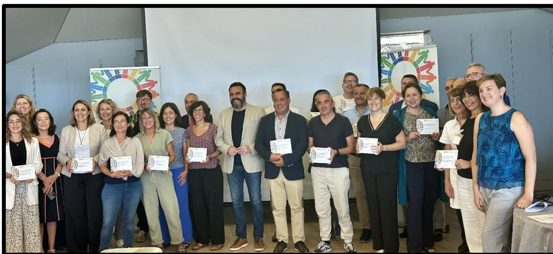
Entrega del premio en Madrid (septiembre 2023).

La Orden AGM/21/2023 estableció la convocatoria de ayudas para la financiación de actuaciones de conservación de la biodiversidad en los espacios Red Natura 2000, en el marco del Plan de Recuperación, Transformación y Resiliencia. La FCQ preparó propuesta de ayuda al Ayuntamiento de Aínsa-Sobrarbe: acciones de conservación, gobernanza ciudadana y sensibilización para la gestión de la Red Natura 2000 en el municipio Aínsa-Sobrarbe, se solicitan 70.000€ (está pendiente de resolución).