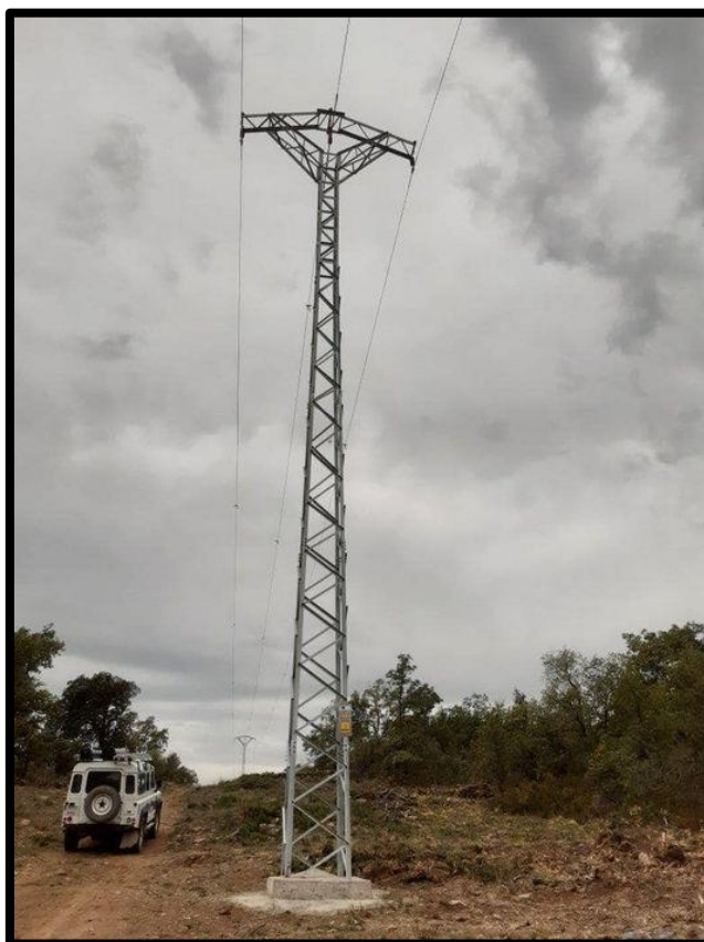
Corrección de tendido eléctrico Arcusa-Paules.

En enero 2023 se finalizada la primera fase de la reforma línea eléctrica Arcusa-Paules de Sarsa a solicitud de la FCQ: tramo M03810-PM6 Arcusa. En noviembre de 2023 el Instituto Aragonés de Gestión Ambiental (INAGA), emite resolución relativa al expediente INAGA/500201/01/2022/10744, denominado "Proyecto de reforma de las líneas aéreas MT.15Kv "Barcabo" entre los apoyos nº 12 y 29 entre los apoyos nº 47 y 110, desde apoyo 3B hasta CT Z08422 y entre los apoyos 137 existente y 168 a instalar (ITER 1582801,1859229,1902221) promovido por ENDESA DISTRIBUCION ELECTRICA, S.L. La FCQ realiza el seguimiento del expediente y promueve la realización de una reunión para enero 2024 entre el INAGA, el Ayuntamiento de Aínsa-Sobrarbe, ENDESA y la FCQ para la corrección del tendido eléctrico.