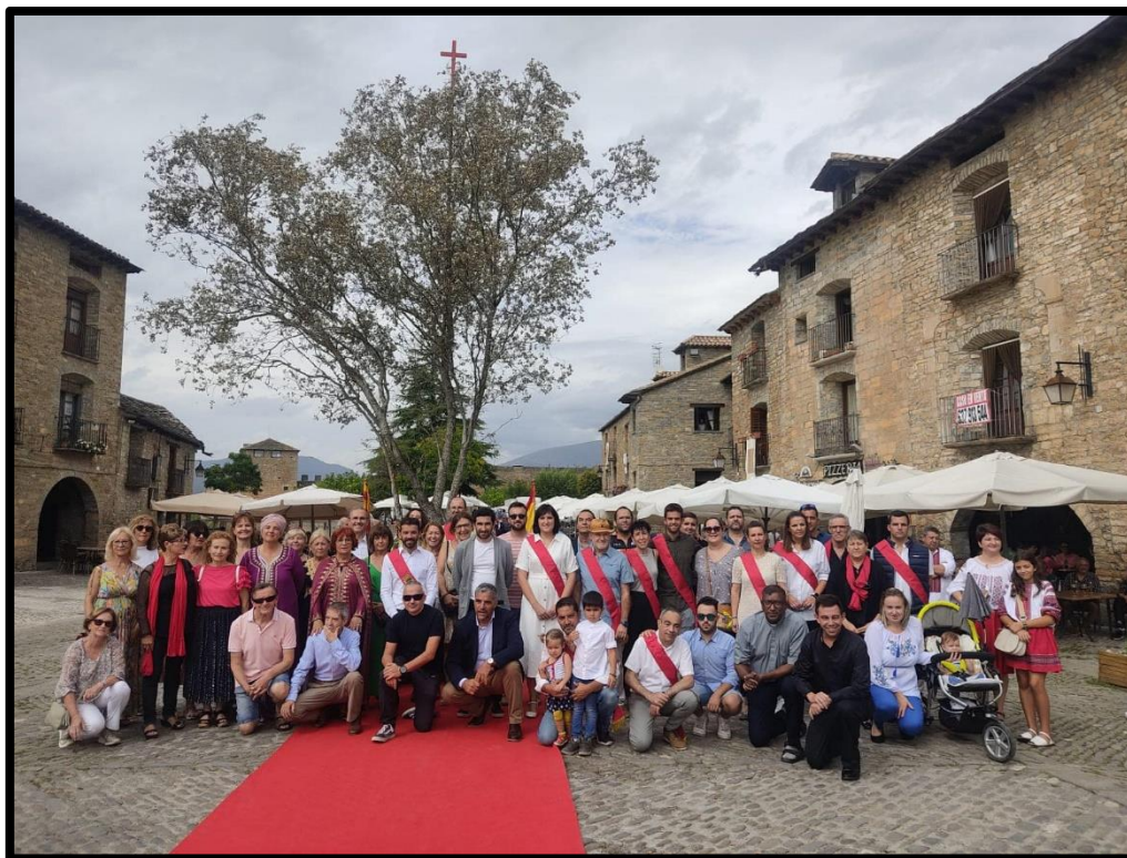
Acto de ofrenda a la Cruz de Sobrarbe.

En septiembre 2023 la FCQ participó en la Ofrenda a la Cruz de Sobrarbe durante las fiestas de Aínsa. En la ofrenda participa todo el tejido asociativo del Municipio de Aínsa-Sobrarbe.