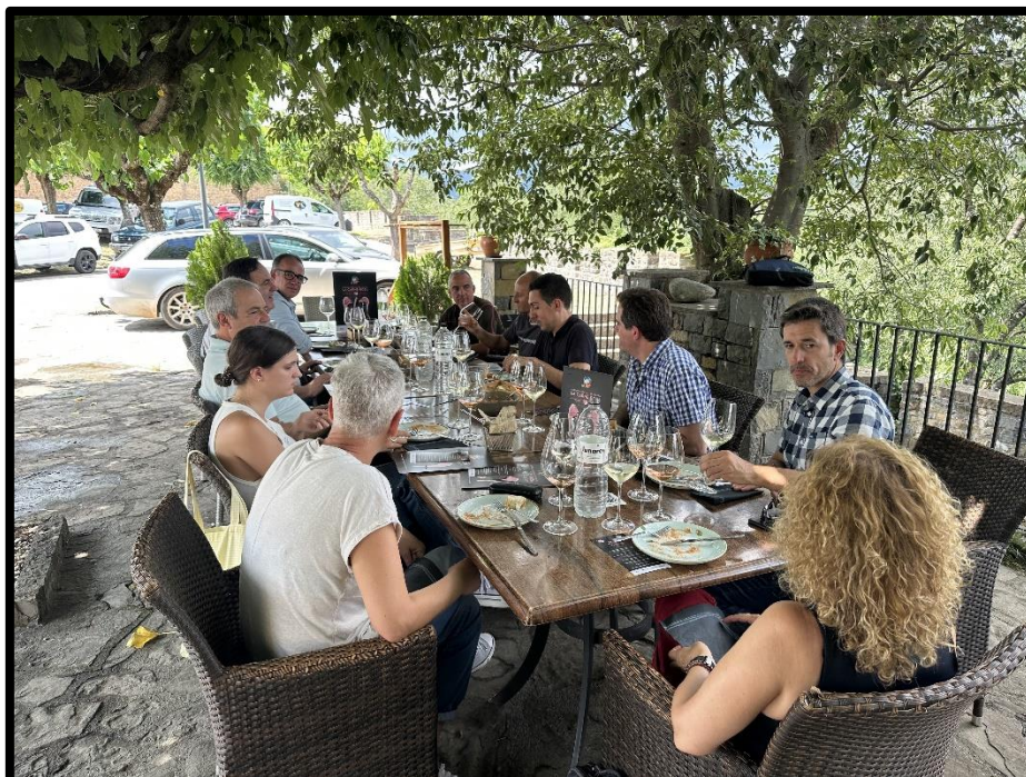
Jornada en el restaurante de la Carrasca en el que periodistas nacionales y locales conocen los detalles de la carne rosa y la campaña de promoción (Aínsa, julio 2023).