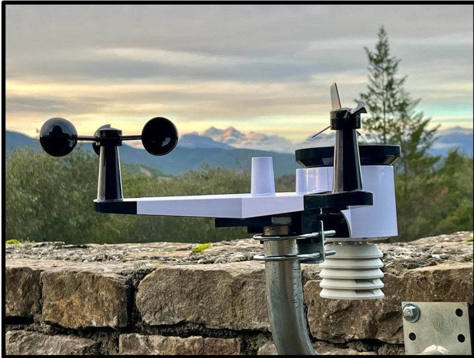
Estación meteorológica del Eco Museo (noviembre 2023).