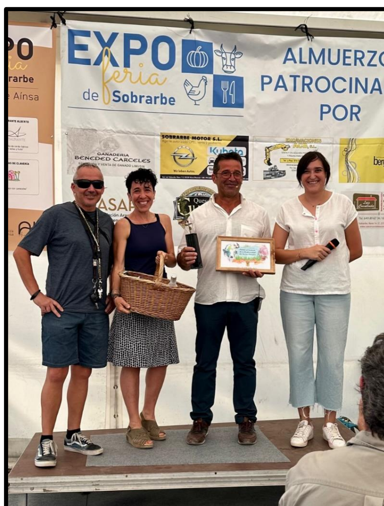
Entrega Premio al Fomento de la Biodiversidad en el Sector Primario (2023).