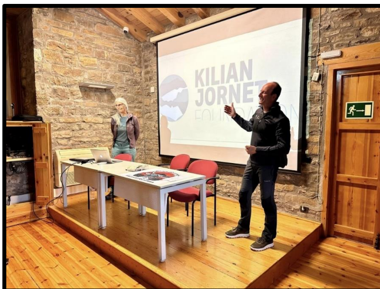
Durante las jornadas celebradas en el Eco Museo.