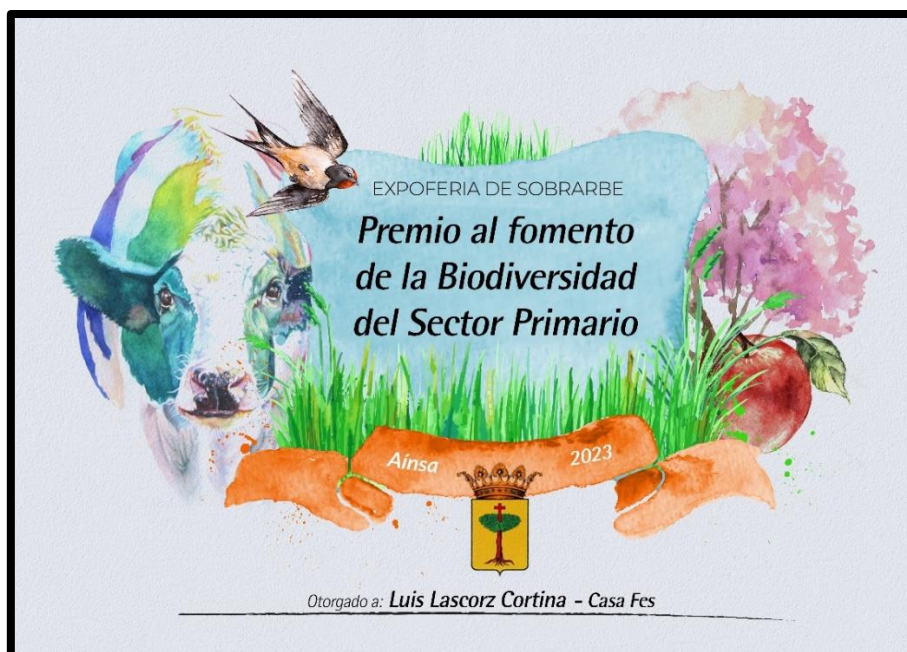
Diploma del Premio al Fomento de la Biodiversidad en el Sector Primario (2023).