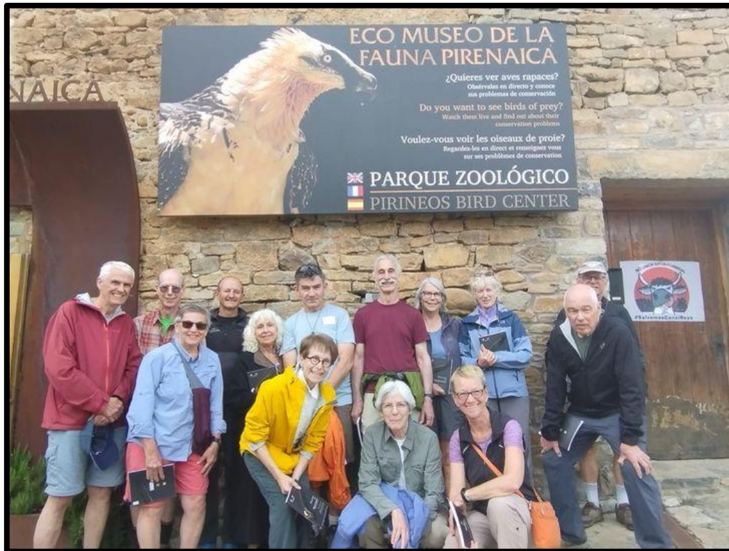
Miembros de la ONG Sierra Club.