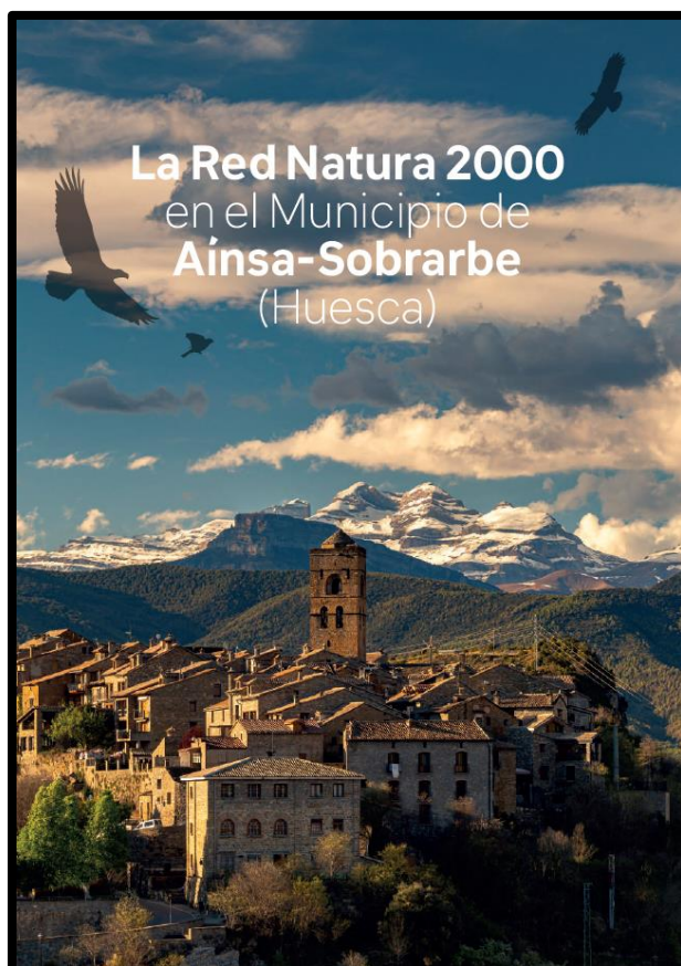
Librillo Red Natura 2000 en el Municipio Aínsa-Sobrarbe.