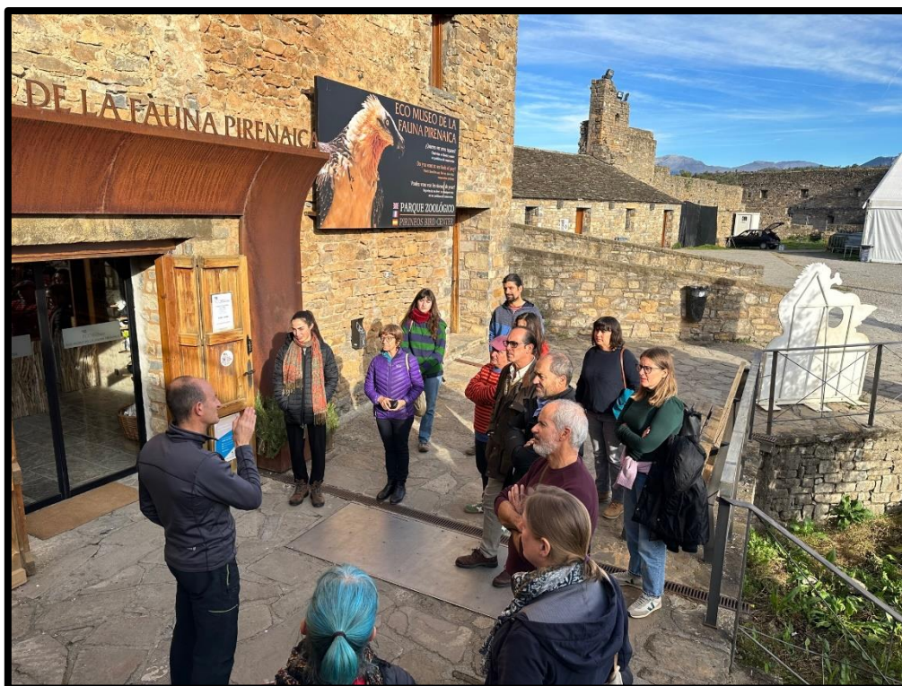
Visita guiada al Eco Museo de los participantes del encuentro Agroecología.