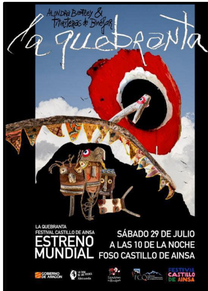
Cartel obra teatral “La Quebranta”.