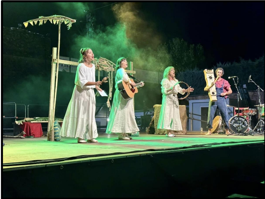
Obra “La Quebranta” (julio 2023).