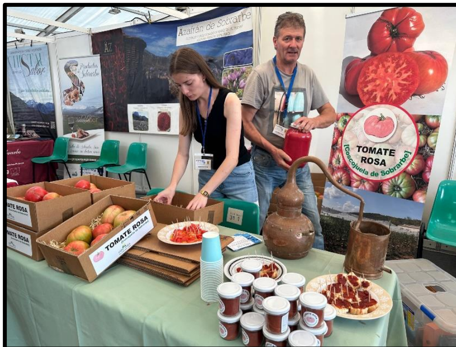
Puesto de producto local en la Expo Feria.