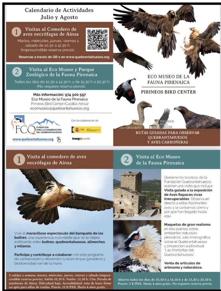
Folleto programa de visitas guiadas comedero y Eco Museo (2023).

https://www.sobrarbe.com/sobrarbe.php?niv=3&cla= 1TD0PME3P&cla2= 6PT0UB82 Q&cla3=&tip=2