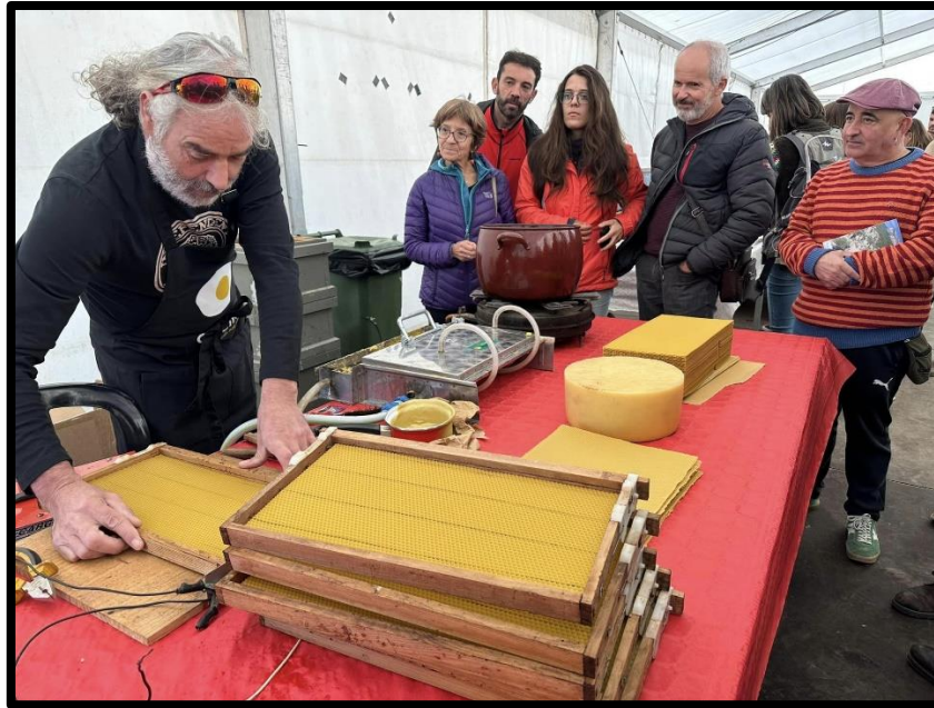
Productor local de miel.