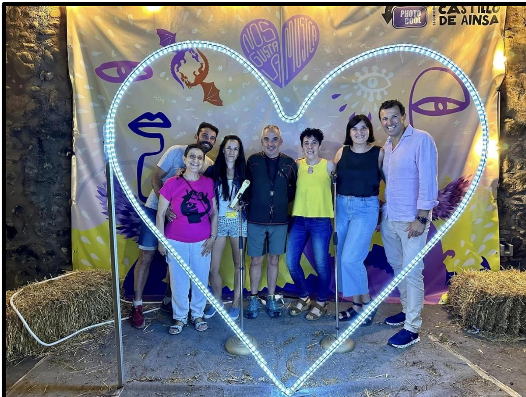
Miembros del Ayuntamiento, FCQ y Titiriteros de Binefar (julio 2023).