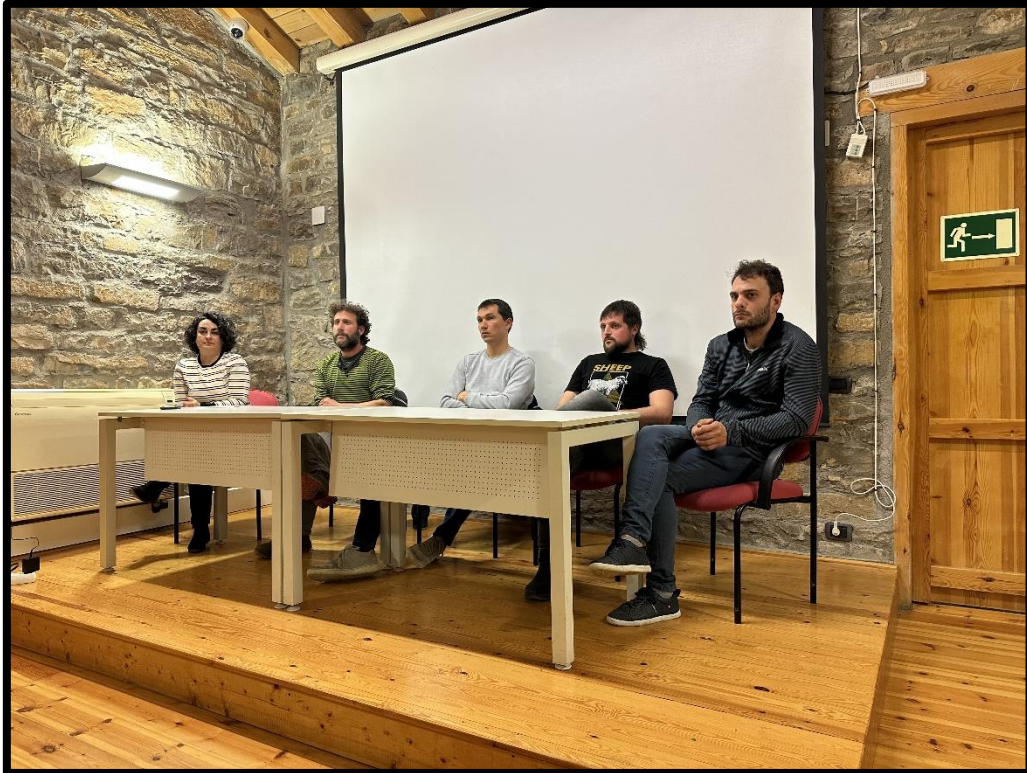
Mesa redonda: visiones del sector agroalimentario en Sobrarbe, en sala DPH.