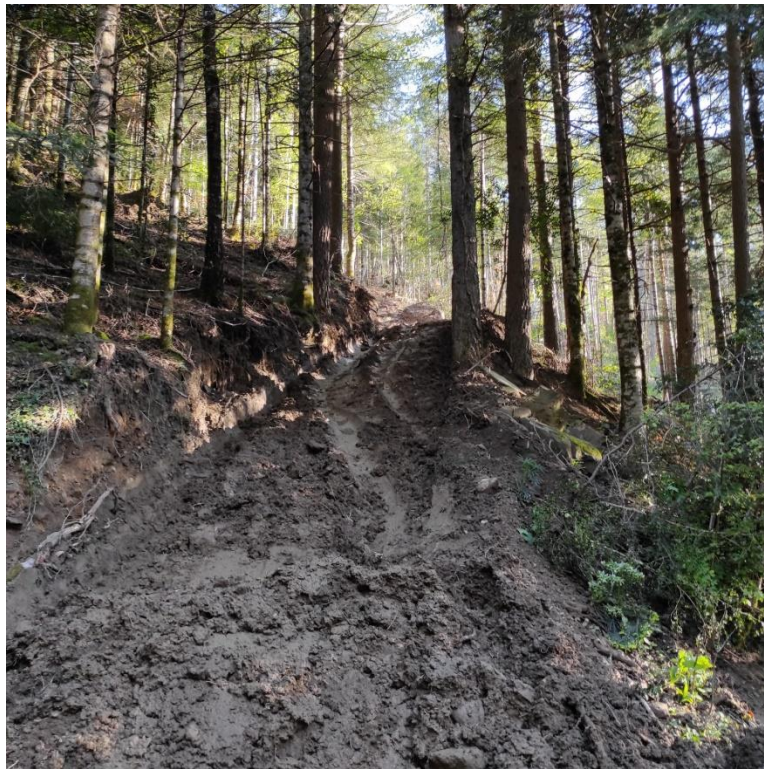
Foto. Vía de saca de madera.

Que el 5-5-2022 la FCQ tuvo conocimiento por un colaborador, que se estaban cortando abetos en la ZEC ES2410029 Tendeñera (ver fotos). Tras lo cual lo puso en conocimiento del Jefe de Servicio de Gestión Forestal de la Dirección General, así como del Director Provincial de Agricultura, Ganadería y Medio Ambiente de Huesca. Posteriormente se nos comunicó que los Agentes de Protección de la Naturaleza (APN) del Gobierno de Aragón, se personaron en el lugar de la corta de los abetos y realizaron una denuncia, cuyo contenido desconocemos.