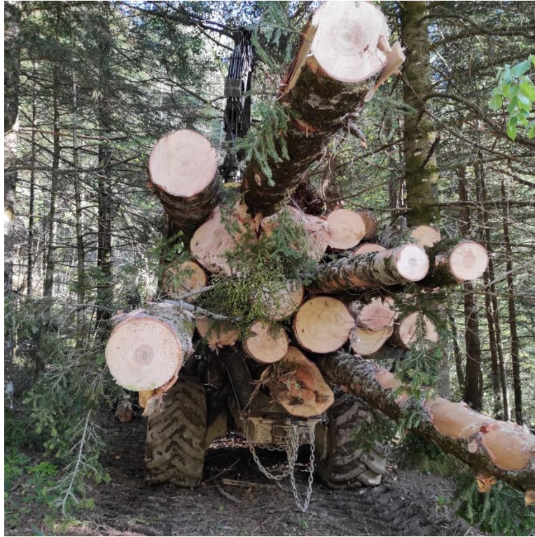
Foto. Detalle de abetos cortados.