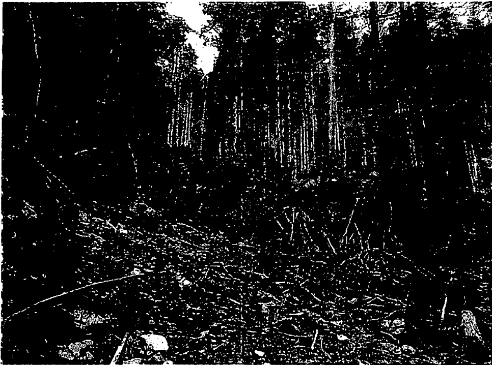
Foto 4. Zona de aprovechamiento.