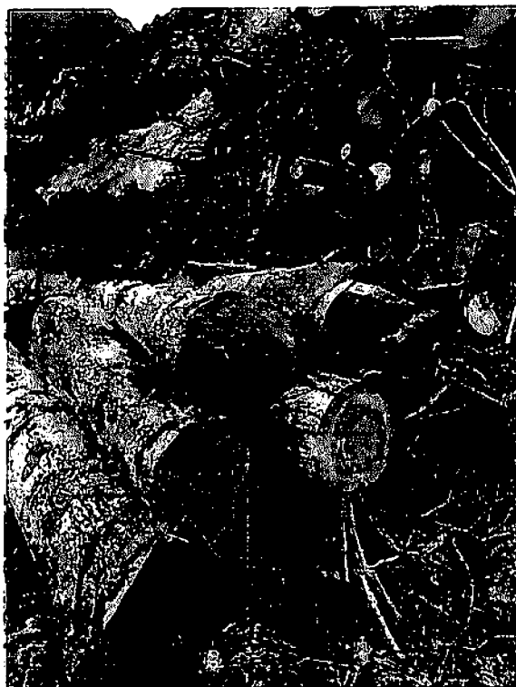
Foto 1. Apilado.