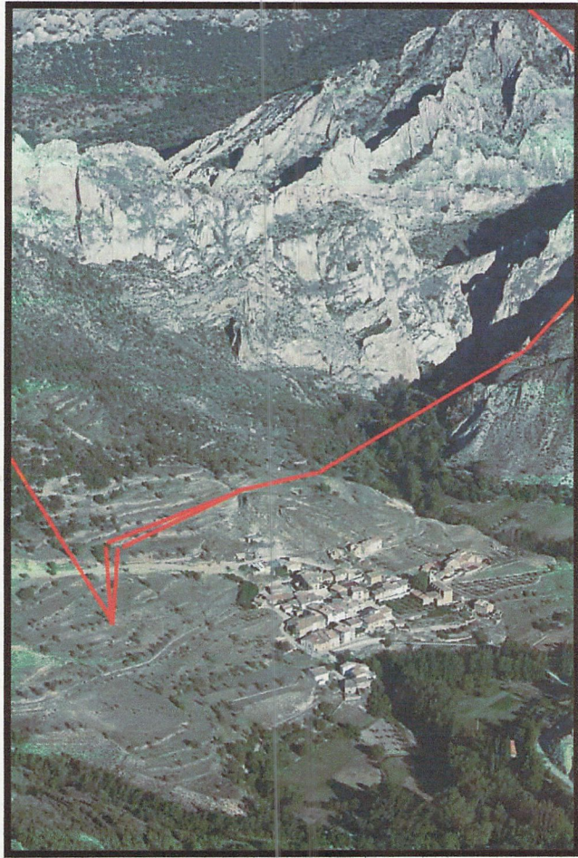
Foto. Montoro de la Mezquita con el trazado de la línea eléctrica.