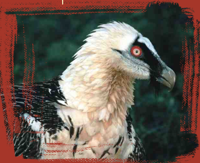
Diseño RAUL Y ALBERTO S. C.

El quebrantahuesos es una de las aves más grandes del continente europeo, casi tres metros de envergadura alar y la única ave osteótega del planeta (alimentación basada en huesos). Su nombre lo recibe de la particular técnica de ruptura de huesos para facilitar su ingesta.