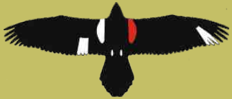
Ejemplo de ave marcada