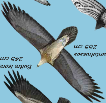
Quebrantahuesos 265 cm