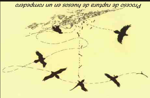
Proceso de ruptura de huesos en un rompedero

El quebrantahuesos es una de las aves más grandes del continente europeo, casi tres metros de envergadura alar y la única ave osteótega del planeta (alimentación basada en huesos). Su nombre lo recibe de la particular técnica de ruptura de huesos para facilitar su ingesta.