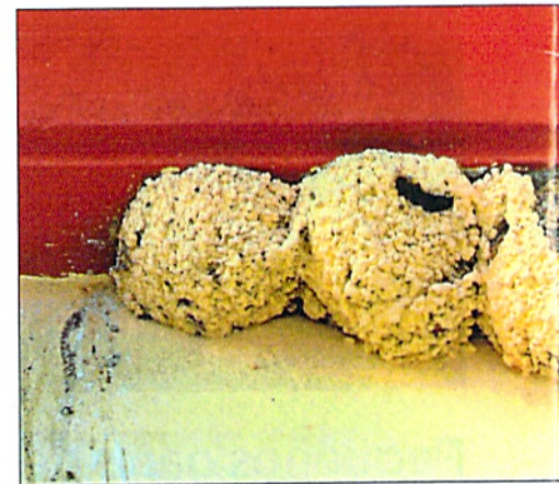
Varios nidos de avión común pintados de color crema, junto a otros posteriores contruidos encima.

A mediados del siglo XX y dentro de las actuaciones del Plan Badajoz, se construyó en Mérida el polígono de la Compañía Española Productora de Algodón Nacional, S.A (CEPANSA), dependiente del Ministerio de Agricultura. Hoy en día, sus naves rectangulares albergan distintas oficinas y empresas, tanto del sector público como privadas. Pero en sus cornisas se ha instalado también una importante colonia reproductora de