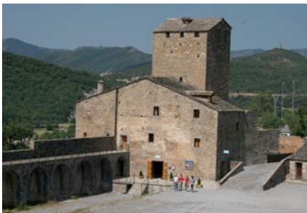
Eco Museo – Centro de visitantes

El programa se desarrolla en la comarca del Sobrarbe (Huesca) y tiene como centros logísticos el citado Eco Museo y la Escuela-Hogar de Boltaña.