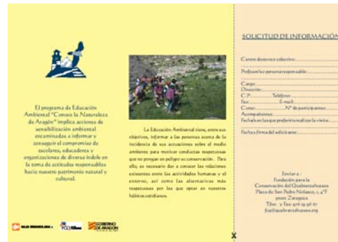
Folleto programa educativo "Conoce la naturaleza de Aragón"