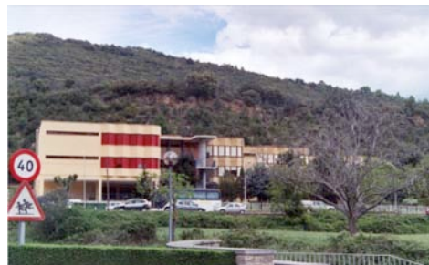
Escuela-Hogar de Boltaña