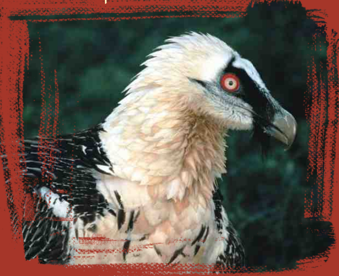
Diseño RAUL Y ALBERTO S.C.