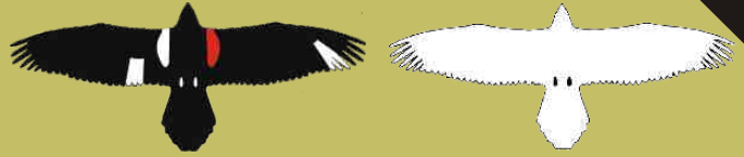
Ejemplo de ave marcada Derecha Izquierda