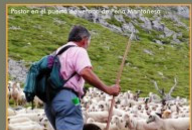
Puerto de verano de Garre