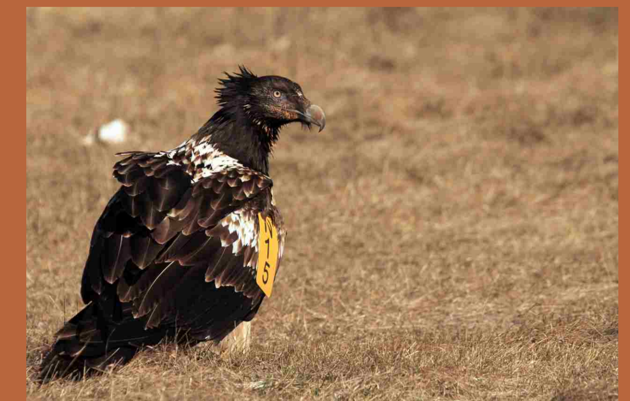
"María" en el comedero de Guara (Huesca).

La atención allop parental en especies altriciales presenta varias hipótesis: comportamiento altruista (Pierotti, 1980), selección de parentesco (Poole, 1982), estrategia del pollo (Hebert, 1988). Este comportamiento se ha descrito en diferentes rapaces: Águila imperial ( Aquila adalberti ) (Ferrer, 1993), Álimoche ( Neophron percnopterus ) (Donazar & Ceballos, 1990), Milano real ( Milvus milvus ) (Bustamante & Donazar, 1990). A continuación se detalla la observación de la atención allop parental de unos adultos de Quebrantahuesos ( Gypaetus barbatus ) a un pollo de Quebrantahuesos criado en cautividad y liberado en el Parque Nacional de Ordesa y Mte. Perdido (PNOMP) en 2011.