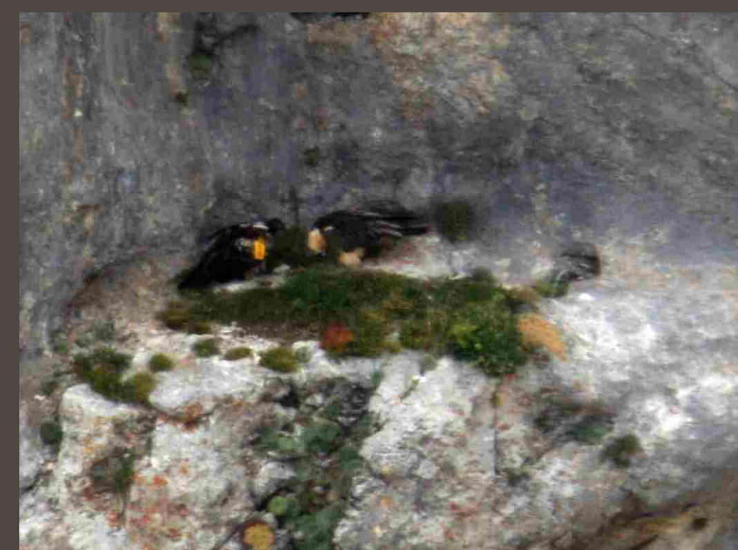
Adulto cebando a "María".

alimento a otro pollo denominado "María". La adopción y primera ceba se produjo a los 30 días de su liberación (18-8-2011). Se realizan observaciones de defensa de "María" frente a otros ejemplares y como ésta realiza por sí misma la rotura de huesos. La frecuencia de las cebas fue cada 2-3 horas. El 27-12-2011 se observa la última ceba de los adultos a "María" (a los 150 días de su liberación). El 24-1-2012 se comprueba que la UR 64 ha iniciado la reproducción y se encuentra incubando. La primera semana de enero de 2012 (180 días), "María" realiza un primer desplazamiento (6 Km./S.) y a finales de enero se observan los primeros desplazamientos de larga distancia hacia los valles de Bujaruelo (15 Km./W.) y Benasque (30 Km./E.) (200 días). El 24-2-2012 se observa en un comedero de Quebrantahuesos en Guara (50 Km./S.) y el abandono del área natal (220 días).