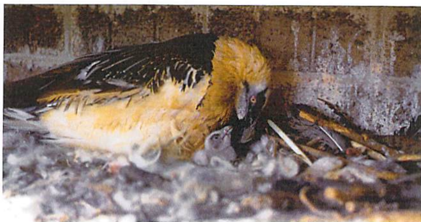
Silvano fue adoptado en el centro de cría de Viena.

Desde la aprobación en 1994 del Plan de Recuperación del Quebrantahuesos en Aragón, se viene realizando un intenso seguimiento de los trabajos de censo, vigilancia y control de los territorios de reproducción. En ellos se ha observado que, a pesar del aumento progresivo de las unidades reproductoras en el Pirineo aragonés (de 39 en 1994 a 72 en 2010) y de las medidas de conservación ejecutadas, existen unidades cuya productividad se encuentra ostensiblemente por debajo de la media, con altas tasas de fracaso reproductor por causas no siempre bien conocidas, aunque sí se sabe que una de las principales es la ausencia de puesta (34'5% para Aragón en 2009).