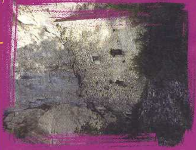
DEPARTAMENTO DE CULTURA Y TURISMO DE ARAGÓN